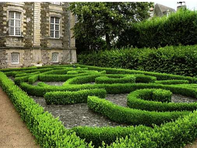
L'un des parterres brodés de la première terrasse de la maison abbatiale de Saint-Georges-sur-Loire.