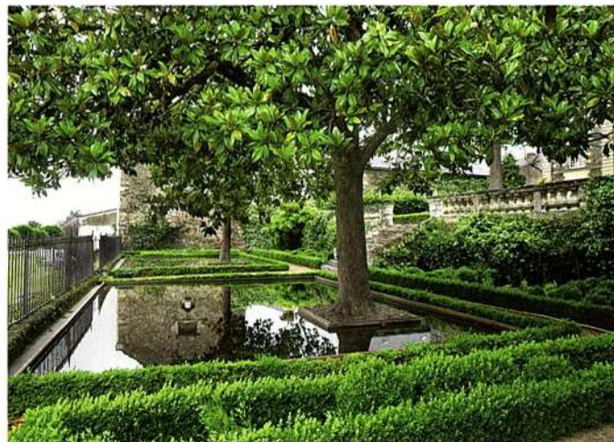
Les miroirs d'eau aux pieds des magnolias sur la deuxième terrasse du jardin de la maison abbatiale de Saint-Georges-sur-Loire.