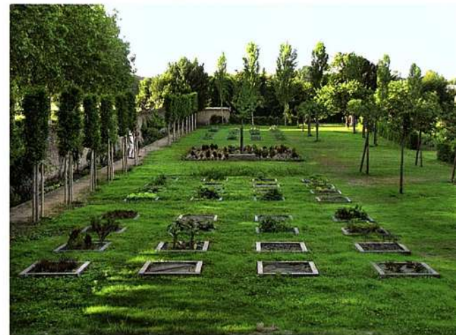
Carrés de légumes et de fleurs près des fruitiers du jardin de la maison abbatiale de Saint-Georges-sur-Loire.